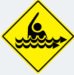
ਲਹਿਰਾਂ ਤੇਜ਼ ਹਨ