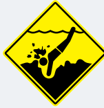
ਪਾਣੀ ਅੰਦਰ ਰੋੜੇ-ਪੱਥਰ ਹਨ