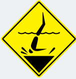
ਪਾਣੀ ਡੂੰਘਾ ਨਹੀਂ ਹੈ