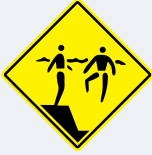
ਪਾਣੀ ਅਚਾਨਕ ਡੂੰਘਾ ਹੋ ਜਾਵੇਗਾ