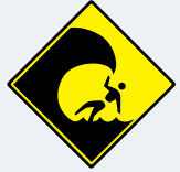
ਲਹਿਰਾਂ ਉੱਚੀਆਂ ਹਨ